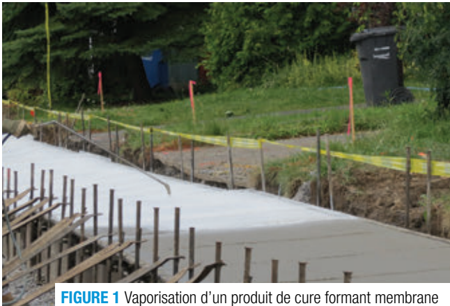
FIGURE 1 Vaporisation d'un produit de cure formant membrane

Les produits de cure formant une membrane sont composés de cire, de résines, de caoutchouc chloré et de solvants très volatils et servent à réduire ou à retarder l'évaporation de l'eau du béton. Ils doivent être appliqués rapidement sur le béton frais ou sur les surfaces de béton après le décoffrage. De plus, ces produits doivent être vaporisés manuellement ou mécaniquement, en respectant le taux d'application recommandé par le fabricant, et être appliqués au moment opportun (figure 1). Leur utilisation est à éviter pendant la période de ressuage du béton.