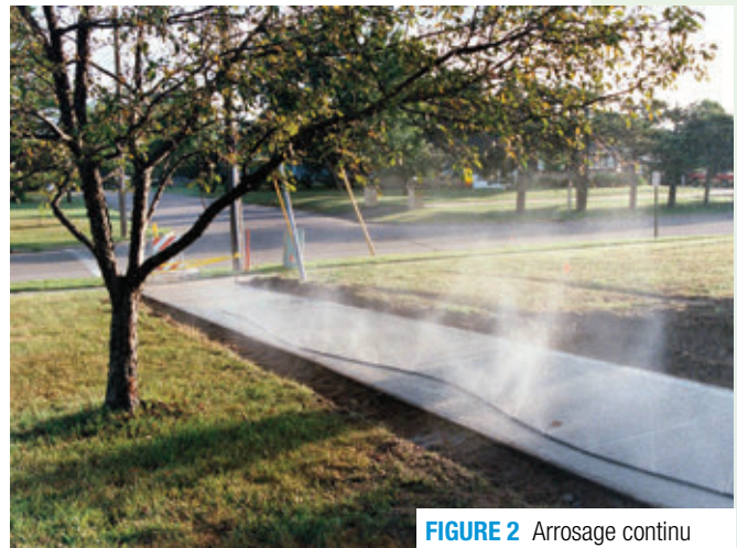
FIGURE 2 Arrosage continu

Les toiles imbibées d'eau sont faites de coton, de jute, de géotextiles ou d'autres matières capables de retenir l'eau et sont fréquemment utilisées. Les toiles doivent être exemptes d'apprêt ou d'autres substances incompatibles avec le béton ou qui peuvent le décolorer. Elles doivent être maintenues continuellement humides durant la période de cure afin d'éviter d'absorber l'eau du béton. Une pellicule de polyéthylène recouvrant la toile diminue le nombre d'arrosages et peut être utilisée lorsqu'un arrosage soutenu est optionnel pour refroidir le béton.