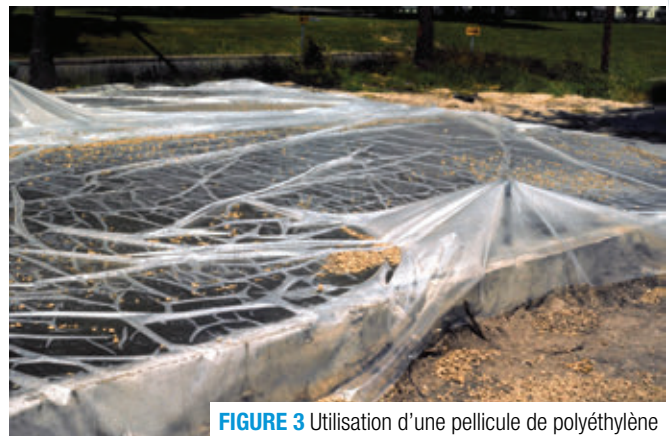
FIGURE 3 Utilisation d'une pellicule de polyéthylène

L'utilisation de pellicules de plastique ou de papiers imperméables peut s'avérer suffisante sur des surfaces horizontales ou sur des bétons structuraux ayant des formes simples (figure 4). Ces méthodes diminuent le besoin d'apport d'eau continu et assurent une hydratation adéquate du ciment en empêchant l'eau de s'évaporer. Elles sont à éviter lorsque les surfaces apparentes du béton sont importantes, ainsi que par temps chaud à cause de l'effet de serre. Si le papier imperméable est abîmé pendant la période de protection, il faut réparer et sceller la partie endommagée.