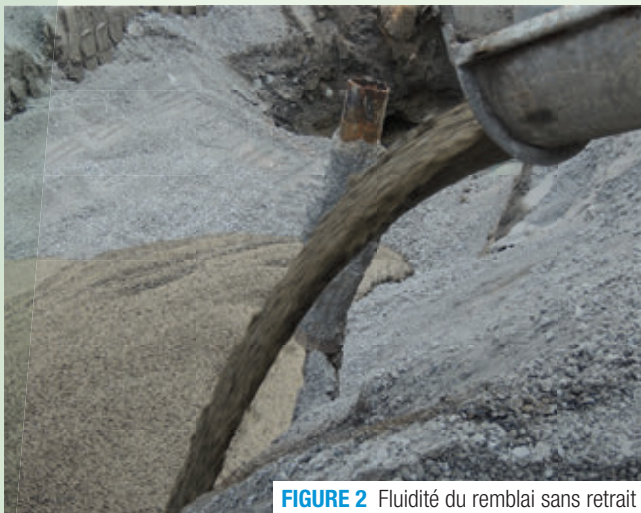
FIGURE 2 Fluidité du remblai sans retrait

Il est à noter que le remblai sans retrait perd de ses caractéristiques pour des applications de faible épaisseur (moins de 300 mm) ou lorsqu'il est inadéquatement mis en place.