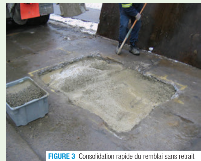
FIGURE 3 Consolidation rapide du remblai sans retrait